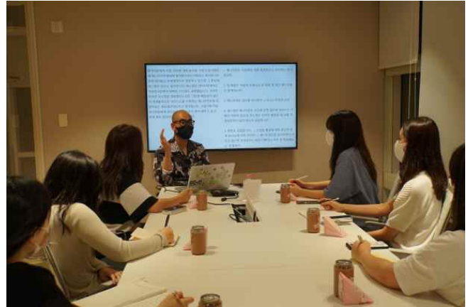
[사진2] SM엔터테인먼트 사옥에서 직무별 소그룹 멘토링을 진행하고 있는 사진 ('22년)