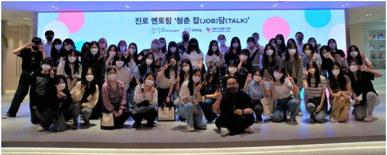
[사진3] SM엔터테인먼트 진로 멘토링 '청춘잡담' 참여자 단체사진('22년)