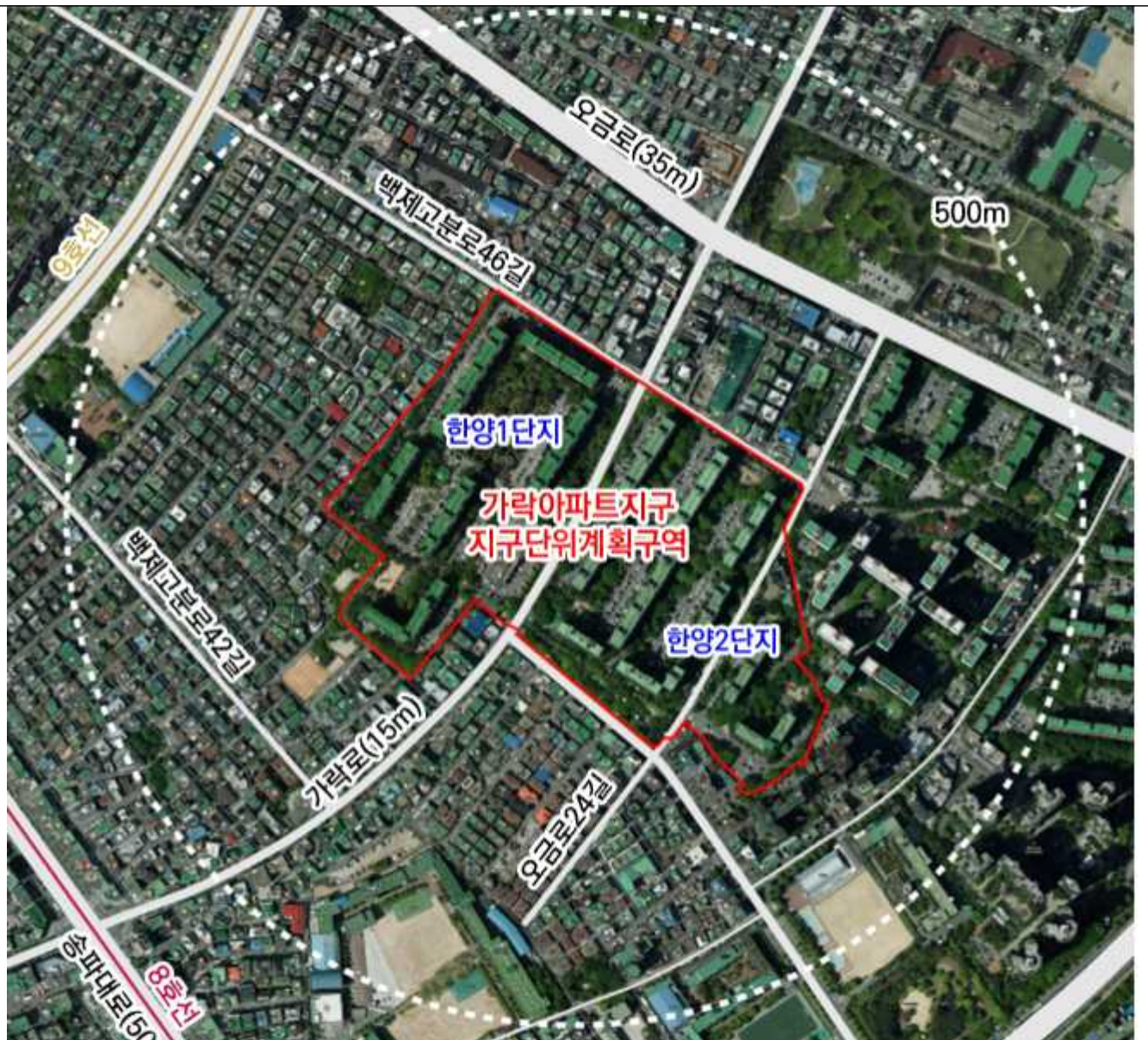
위 치 도