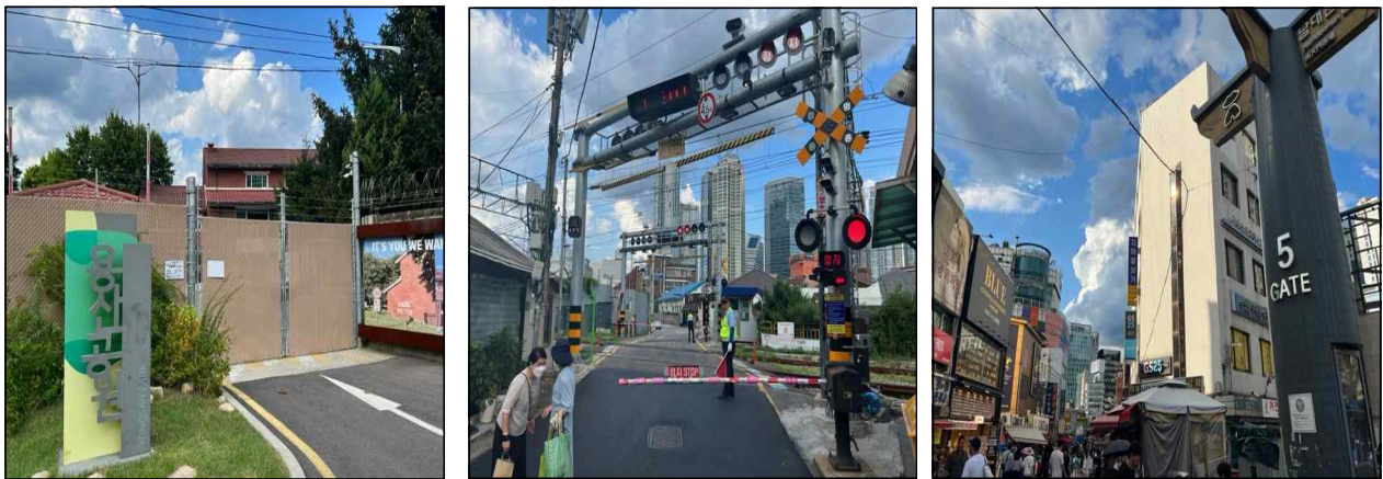
▲ 신규 코스 명소 사진. 용산공원(좌측), 항동철길(가운데), 남대문시장(우측)