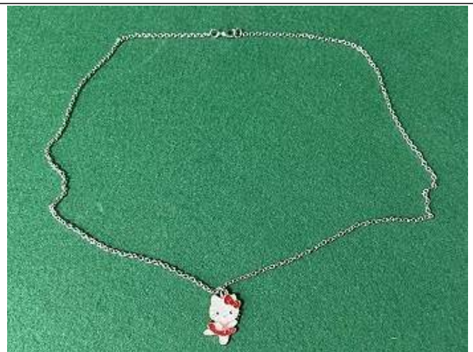
< 어린이용 목걸이 >

<5월 넷째 주 안전성 조사 부적합 제품 사진>