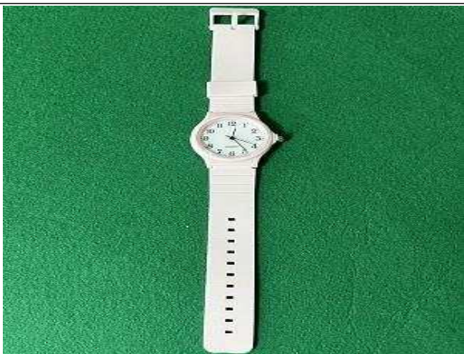
< 어린이용 시계 >