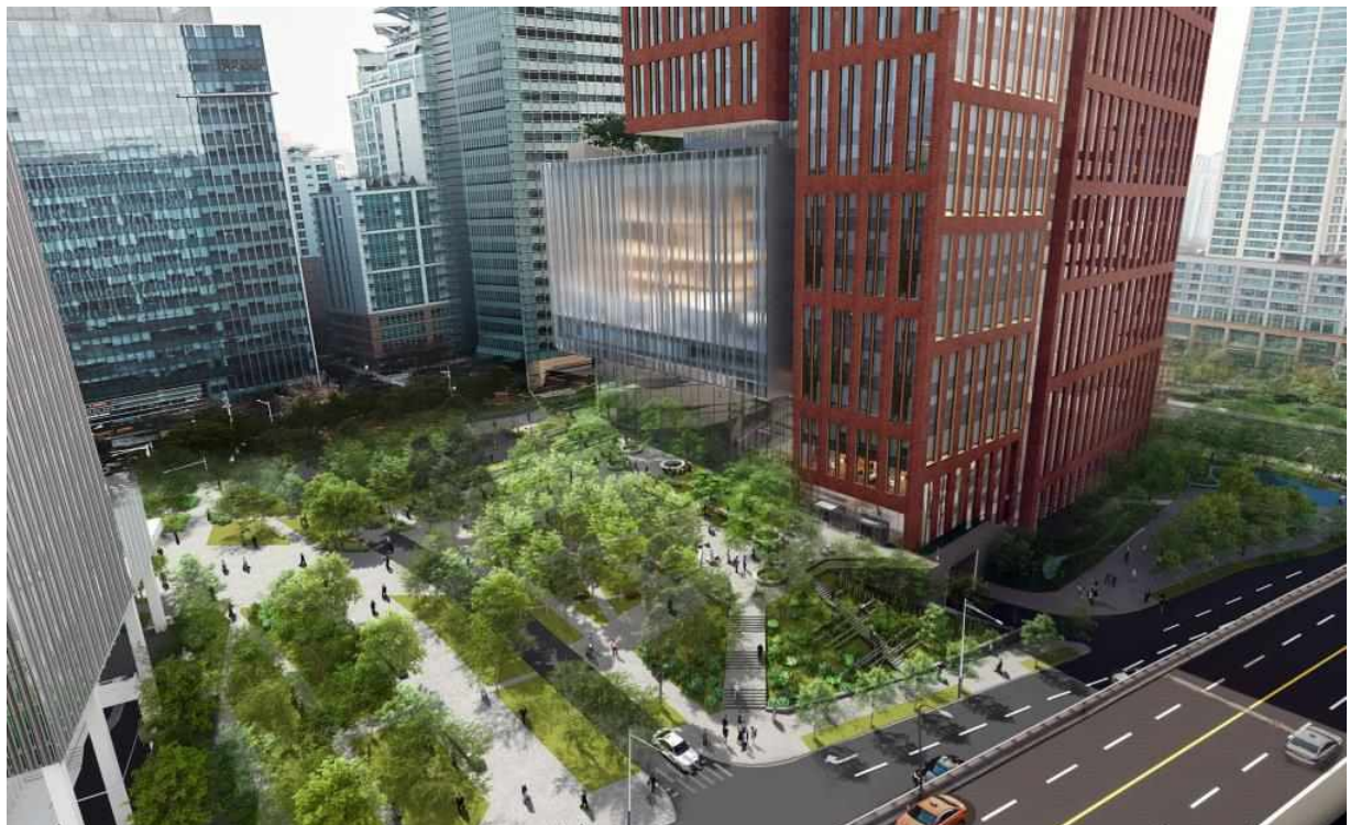
< 지구 동측 >