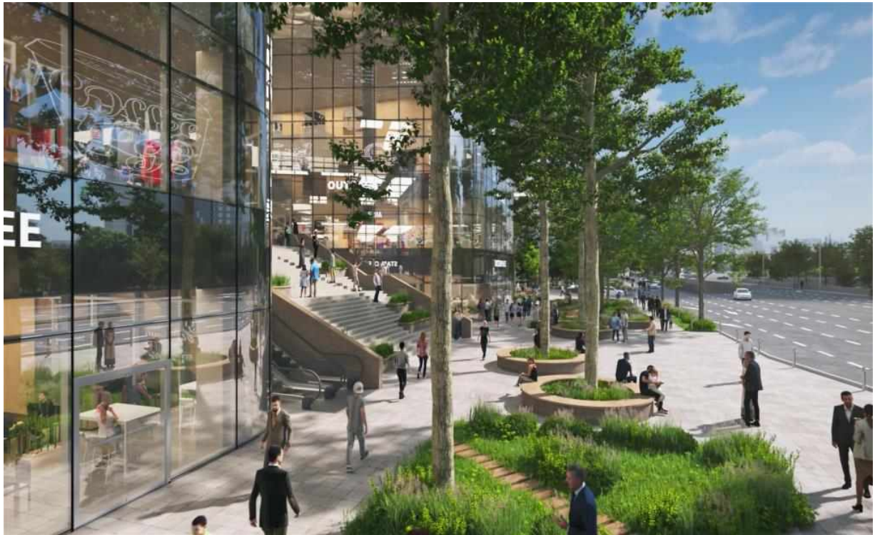
< 지구 서측 >