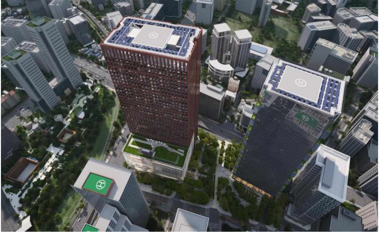
< 서소문일대 통합계획(안) >

□ 공연장 계획(안) ※ 본 예시도는 향후 건축심의 등에 따라 조정될 수 있음