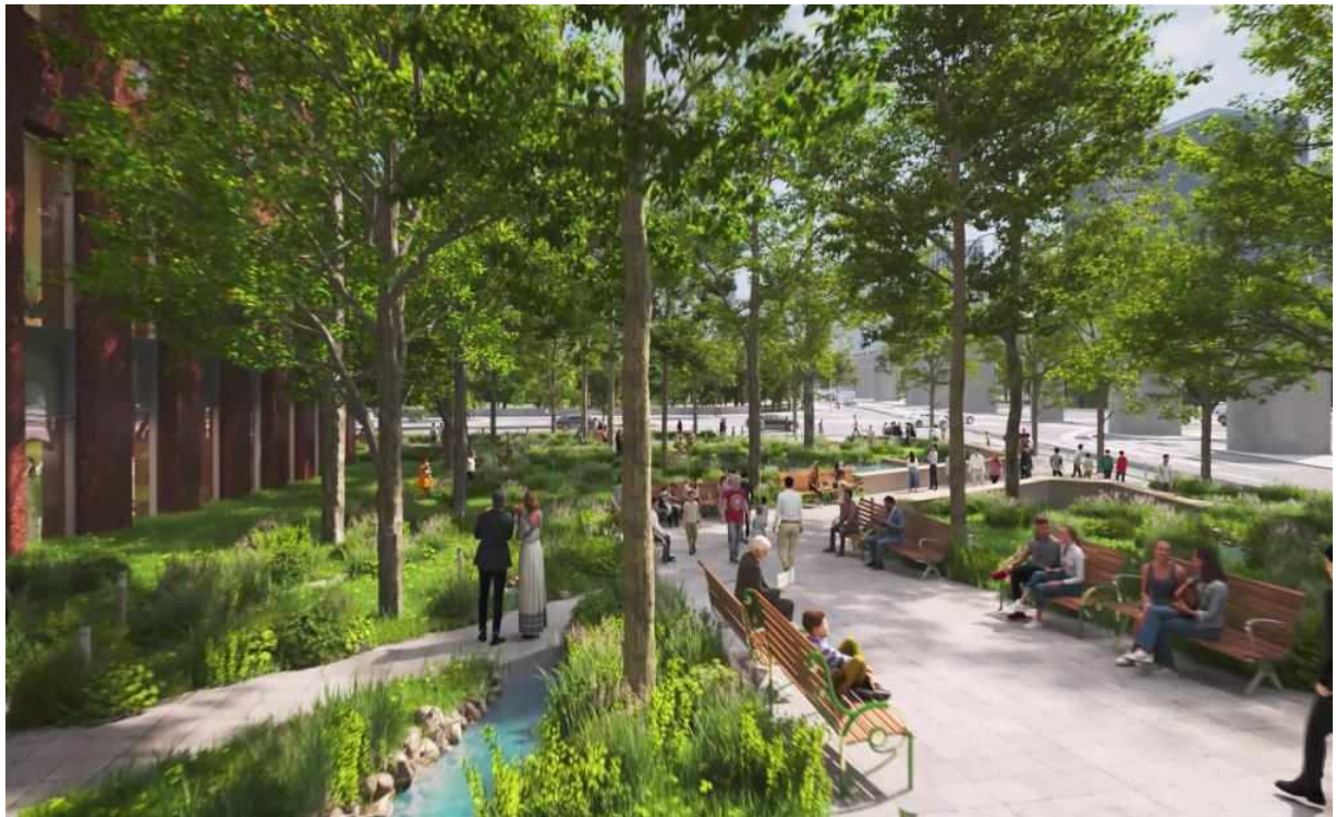
< 지구 북측 >