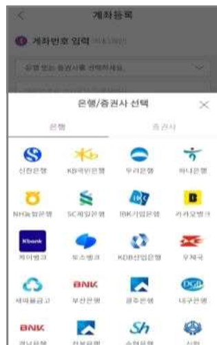
< 계좌등록 >