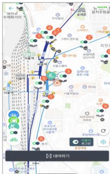
< 티머니 자전거 화면 >