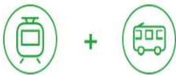
① 62,000원권(서울지역 지하철, 버스)