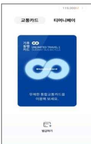
< 앱다운로드 및 회원가입 >