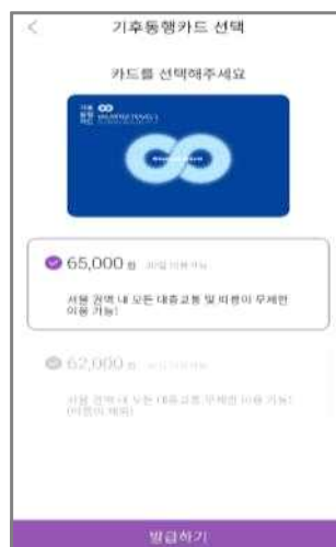
< 권종선택 >