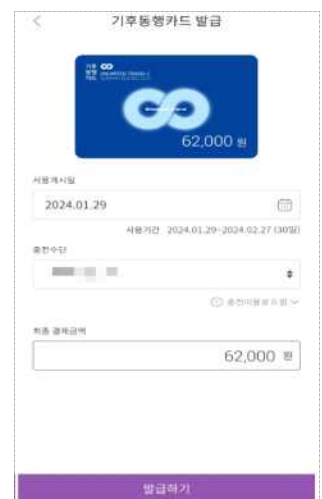
< 사용개시일 선택 >