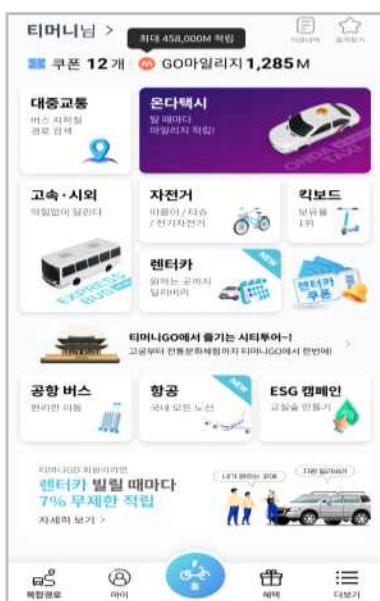
< 티머니 홈화면 >