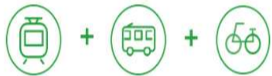
② 65,000원권(서울지역 지하철, 버스 + 따릉이)