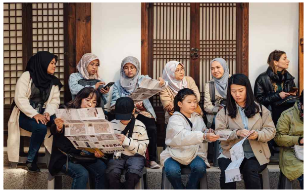
한옥 방문객 풍경