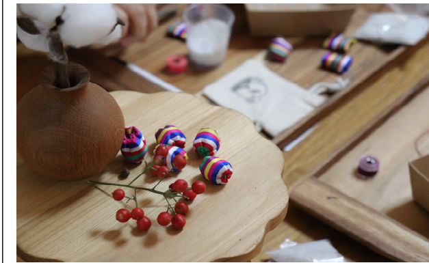
색동 공깃돌 만들기