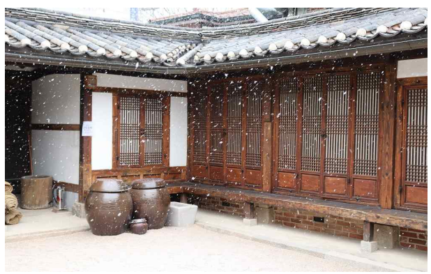
겨울 한옥 풍경