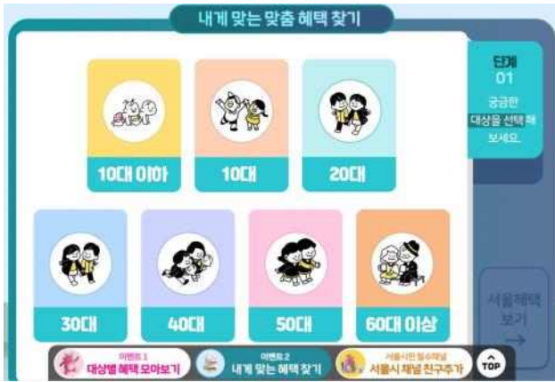
(1단계) 연령대 선택