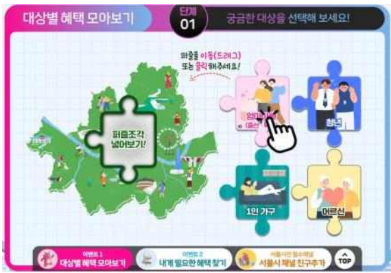
(1단계) 궁금한 대상 선택