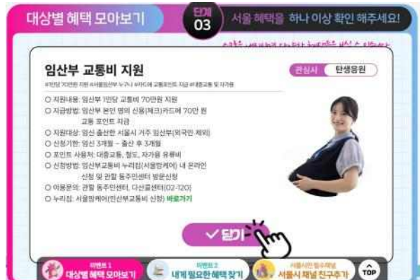
(4단계) 정책 내용 확인