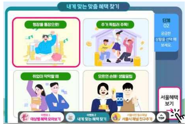
(2단계) 주요 상황 및 관심사 선택