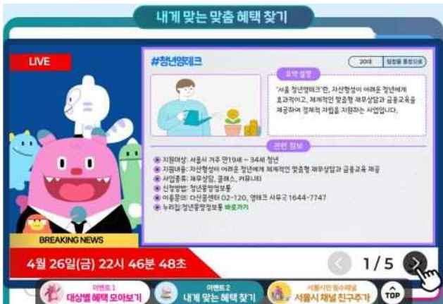
(3단계) 맞춤 정보 확인