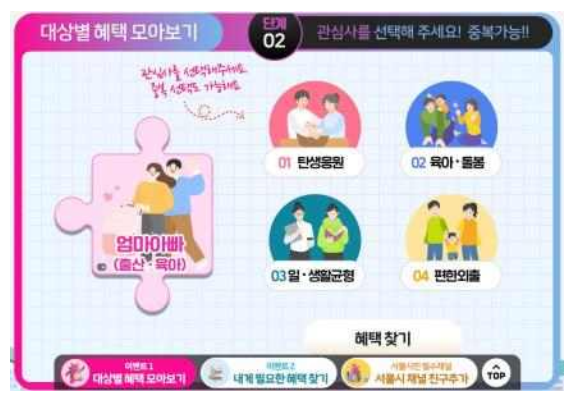
(2단계) 관심사 선택