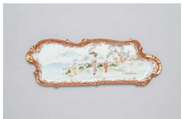
백자 다채 접시 사진 2(HL17354)