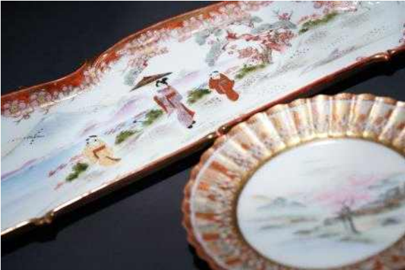
백자 다채 접시 단체 사진(HL17354, HL17352)