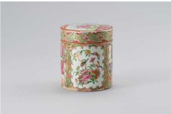
백자 다채 합 사진 1(HL17332)