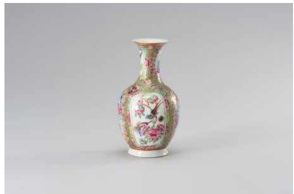
백자 다채 병 사진(HL17320)