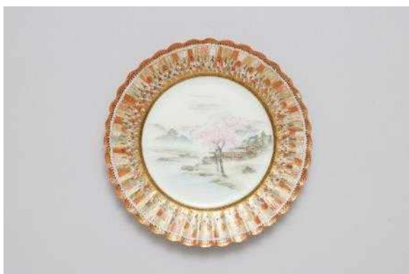
백자 다채 접시 사진 1(HL17352)