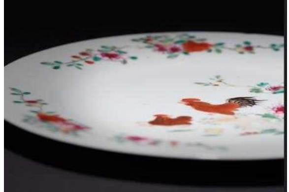
백자 다채 접시 사진(HL17350)