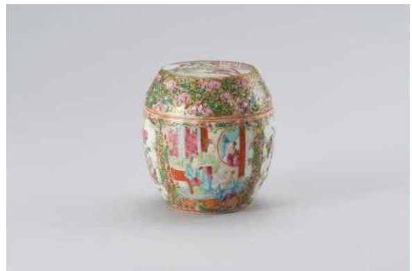
백자 다채 합 사진 2(HL17333)