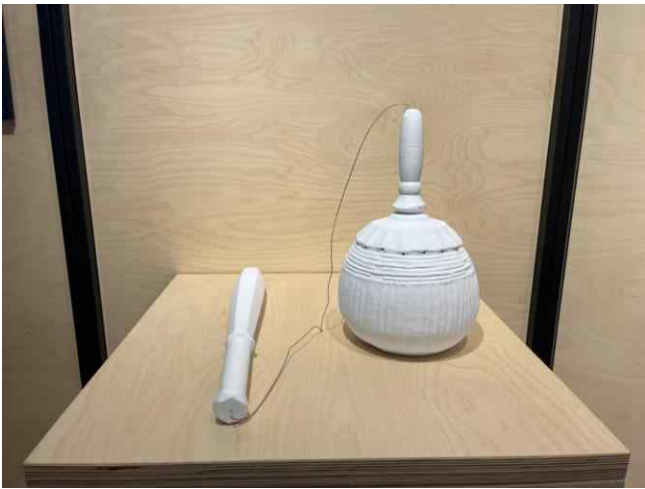
관람객 체험용 조족등과 육모방망이(복제품)