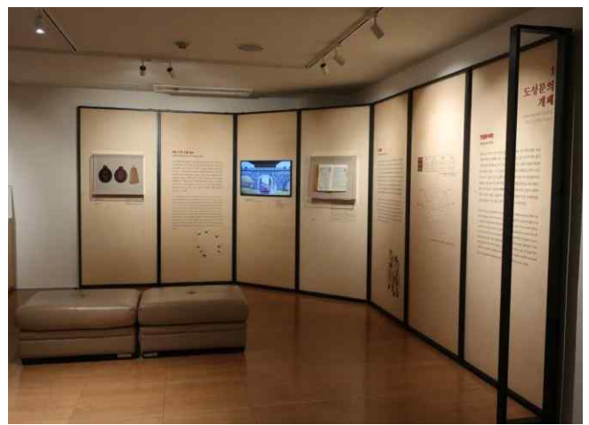
파트 I '도성문의 개폐(開閉)'