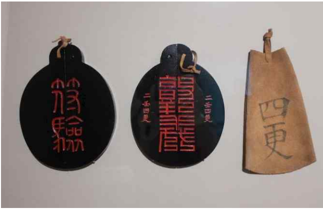
부험(符驗)과 부험주머니 (복제품) 조선시대, 국립고궁박물관 소장품