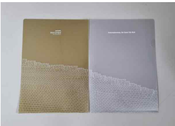
한양도성박물관 L자 홀더 한양도성박물관 관람객 증정 기념품