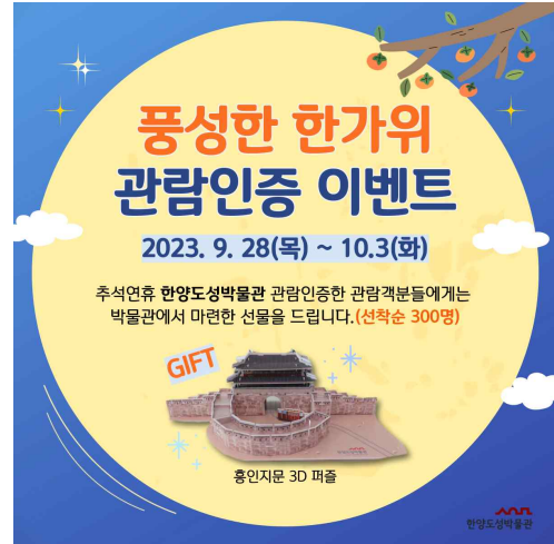
한양도성박물관 관람인증 이벤트 홍보물