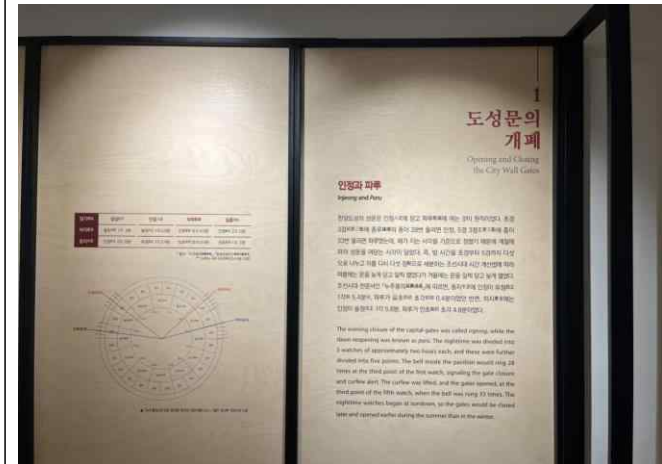
파트 I '도성문의 개폐(開閉)'