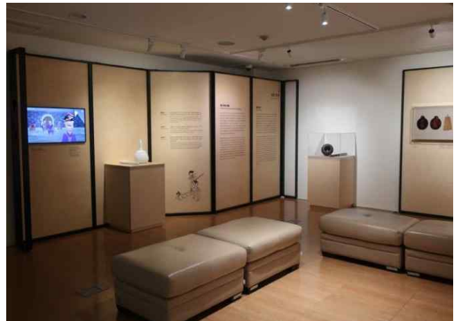
파트 II '성문 관리'