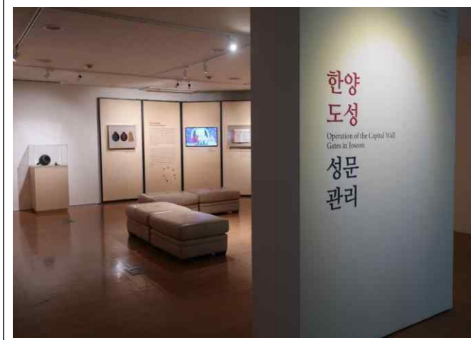
한양도성박물관 특새전시 <한양도성의 성문 관리> 전시 모습