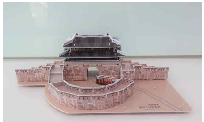
흥인지문 3D 퍼즐 한양도성박물관 인스타그램 관람인증 증정품