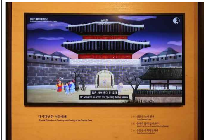
성문 개폐 관련 일화 애니메이션