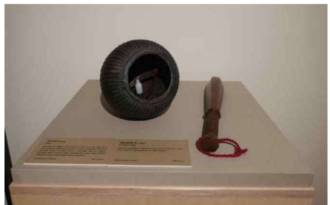
조족등과 육모방망이 (복제품) 조선시대