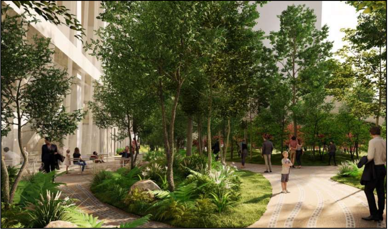
〈3-2·3구역 동측과 8·9·10구역 북측〉