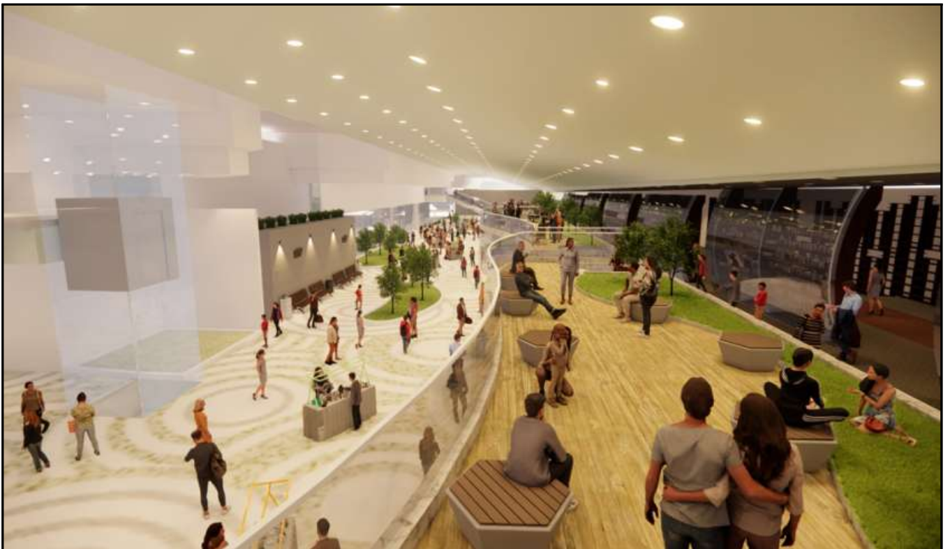
〈3-2-3, 3-8·9·10구역과 을지로 지하공간 연계〉