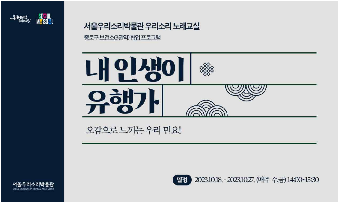
[사진 1] 서울우리소리박물관 우리소리 노래교실 <내 인생이 유행가>