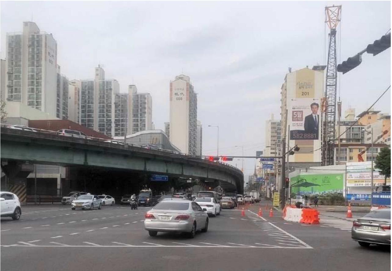
양화대교 방향(철거 전)