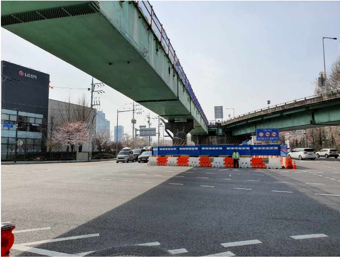
목동교 방향(철거 전)