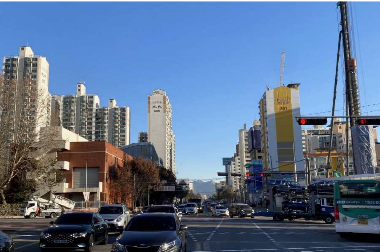
양화대교 방향(철거 후)