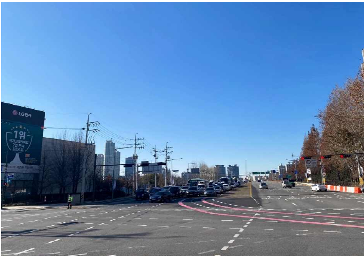
목동교 방향(철거 후)