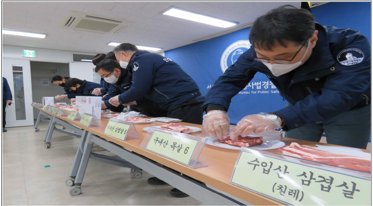
▲ 돼지고기 원산지 신속 검정키트 시연 장면