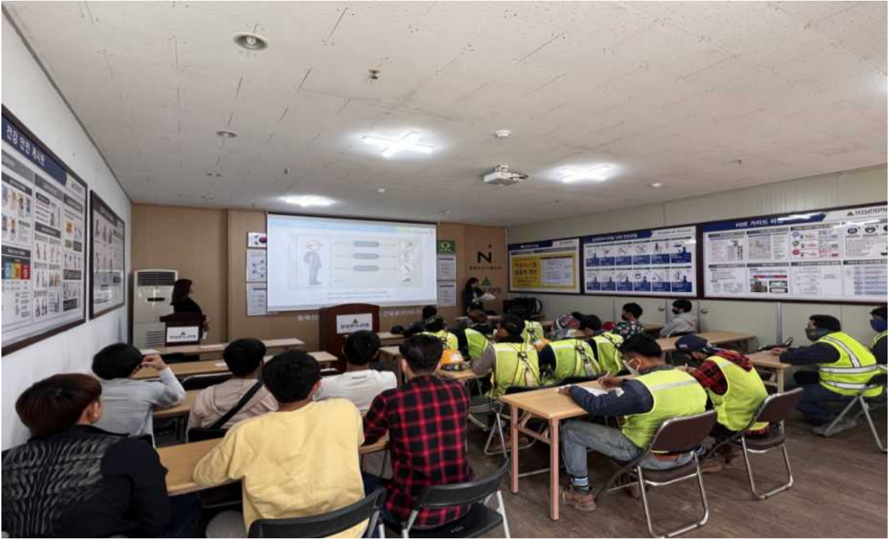
▲ 2023년 상반기 외국인 근로자 안전교육(2023.5.8)