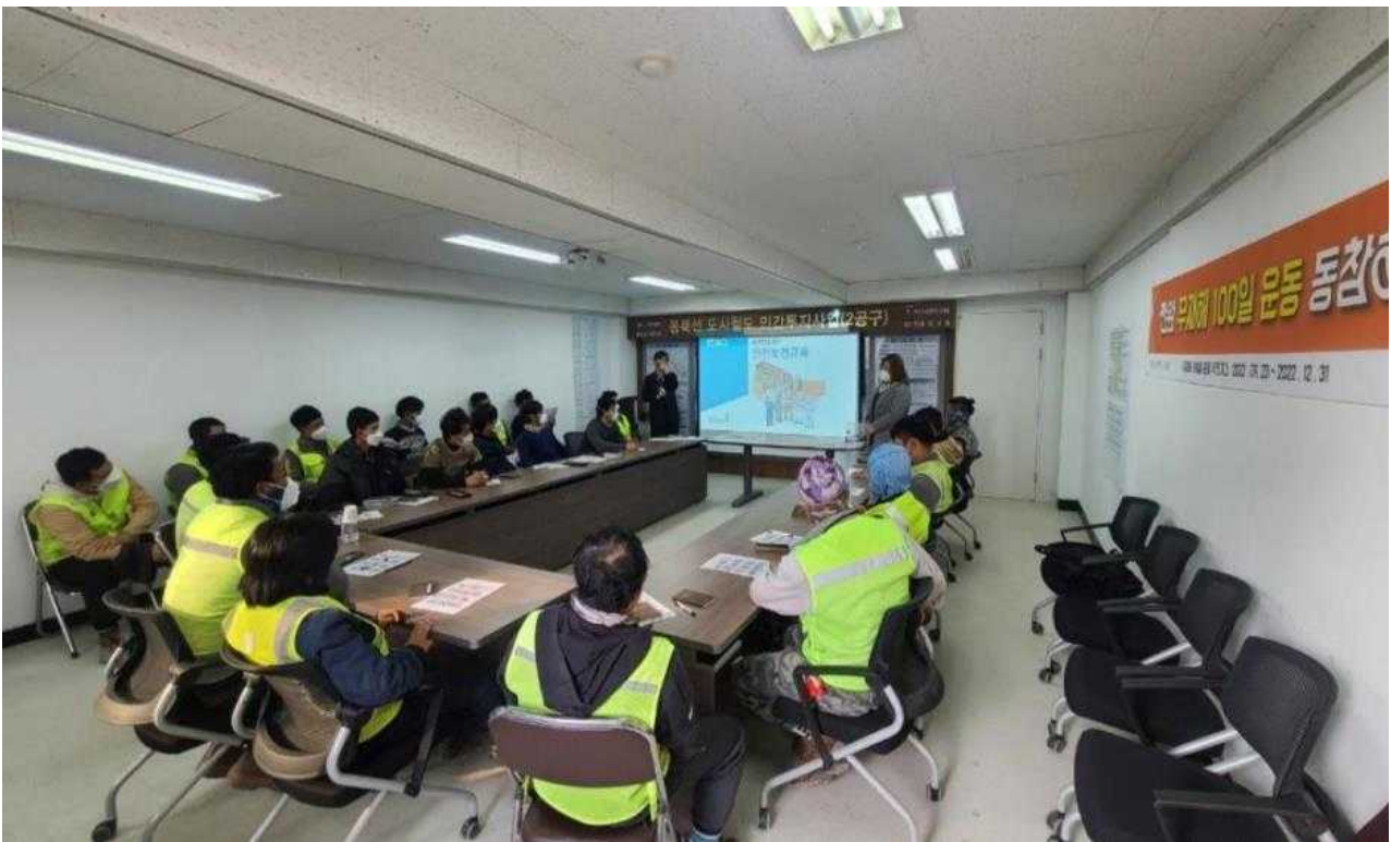
▲ 2022년 하반기 외국인 근로자 안전교육(2022.11.10)