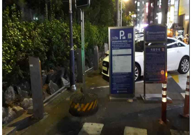
서울특별시 강남구 '언북초등학교' 주변도로 불법 입간판 제거