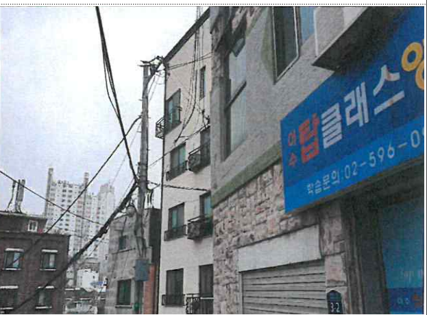
서울특별시 동작구 '경문고등학교' 주변도로 안전 위험 간판 제거