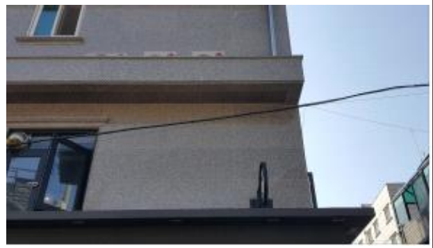
서울특별시 동대문구 '군자초등학교' 주변도로 불법 벽면이용 광고물 제거