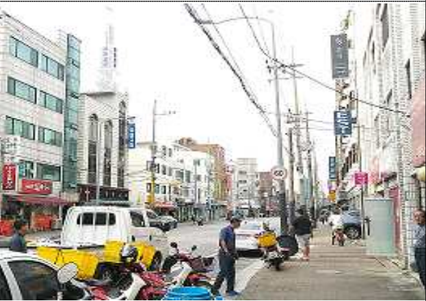
서울특별시 중랑구 '신목초등학교' 주변도로 불법 에어라이트 제거