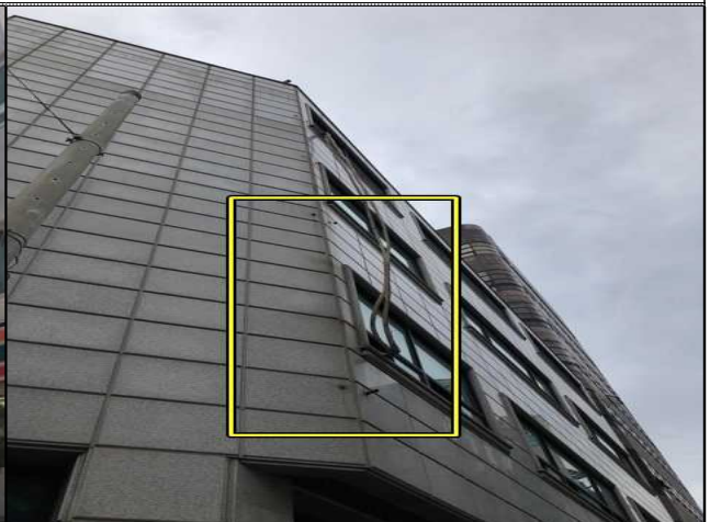
서울시 서초구 '서초중학교' 주변도로 불법 돌출간판 제거