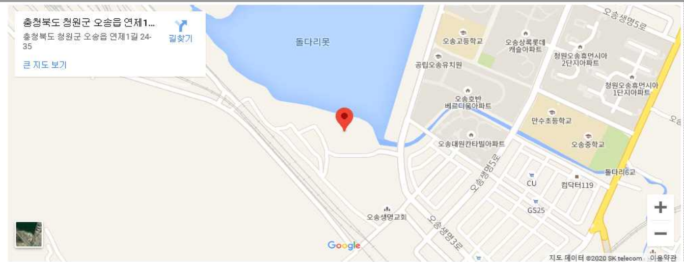
오시는 길 : 충청북도 청원군 오송읍 연제1길 24-35