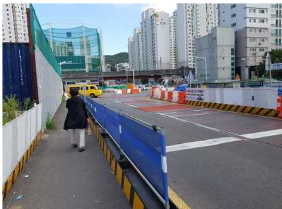
보행자 통행로 - 차도 - 공사현장 간 분리(좌측)