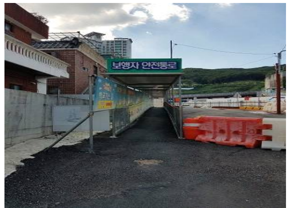
보행자 안전통로 배치