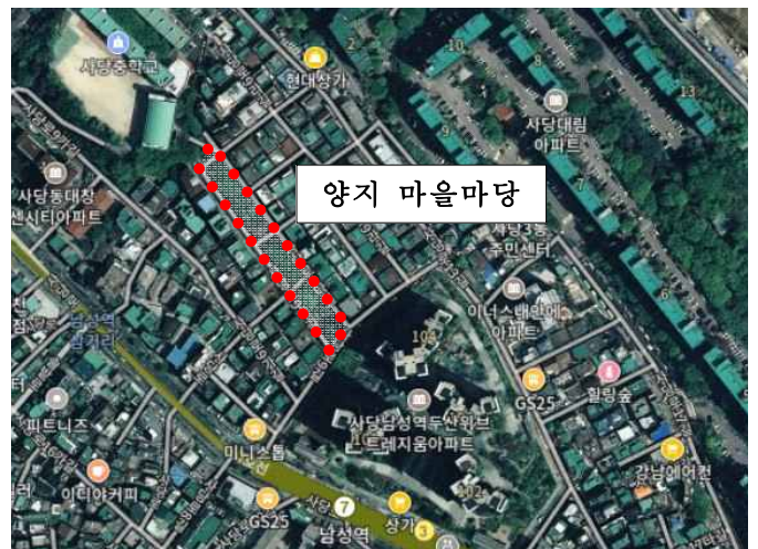
〈 위치도 〉