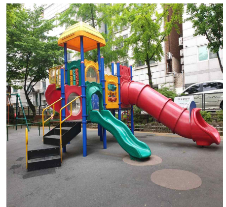
〈 현황사진 - 양지마을마당 〉