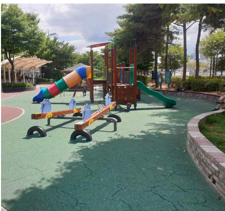
〈 현황사진 - 도화공원 〉