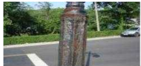
승화원 노후 보안등 2