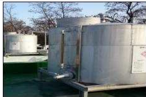
암모니아수 보관탱크(화장로 구관 및 신관)