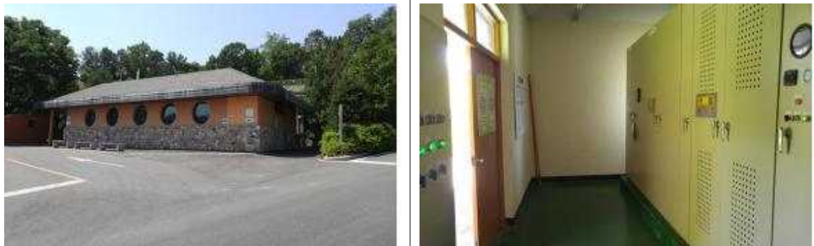
왕릉식 화장실 유희공간(기존 전기실)을 화장실 공간으로 확장