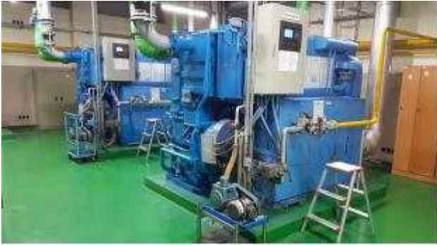
흡수식 냉난방기('00년 설치)