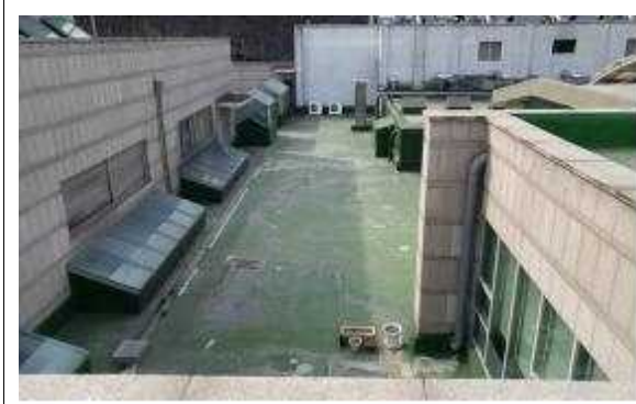
지붕층 방수시트 파손(노후)