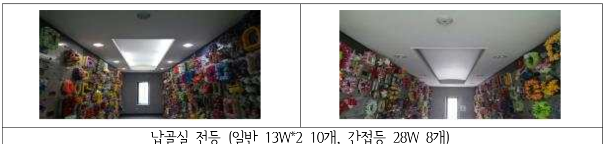
납골실 전등 (일반 13W*2 10개, 간접등 28W 8개)