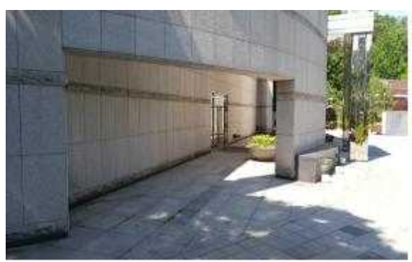
제레단 추가 설치(개선)