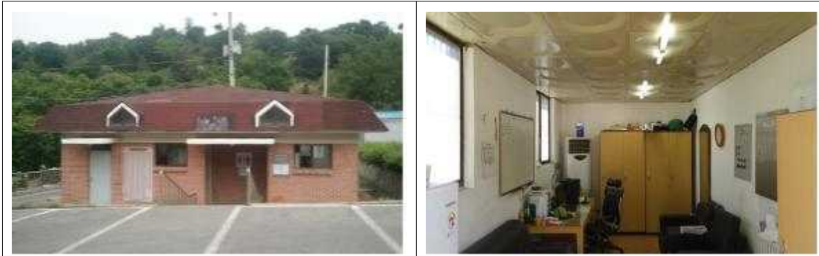
분묘식 화장실 유희공간(대기실)을 화장실 공간으로 확장