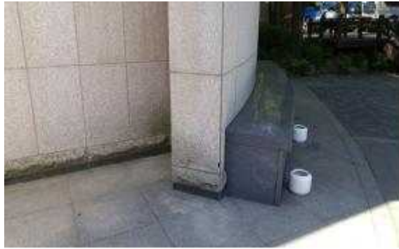
파손 석재 교체(파손)