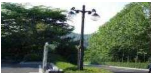
승화원 노후 보안등 1