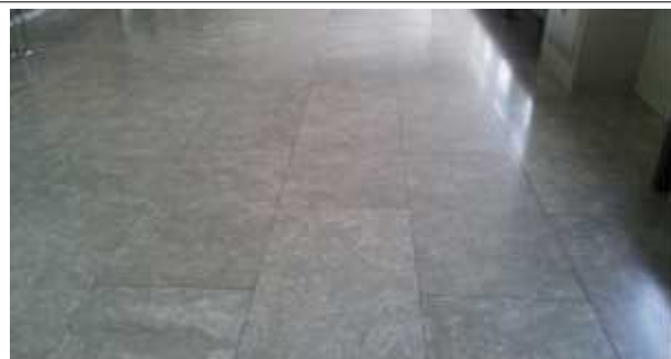
추모공원 바닥대리석 사진