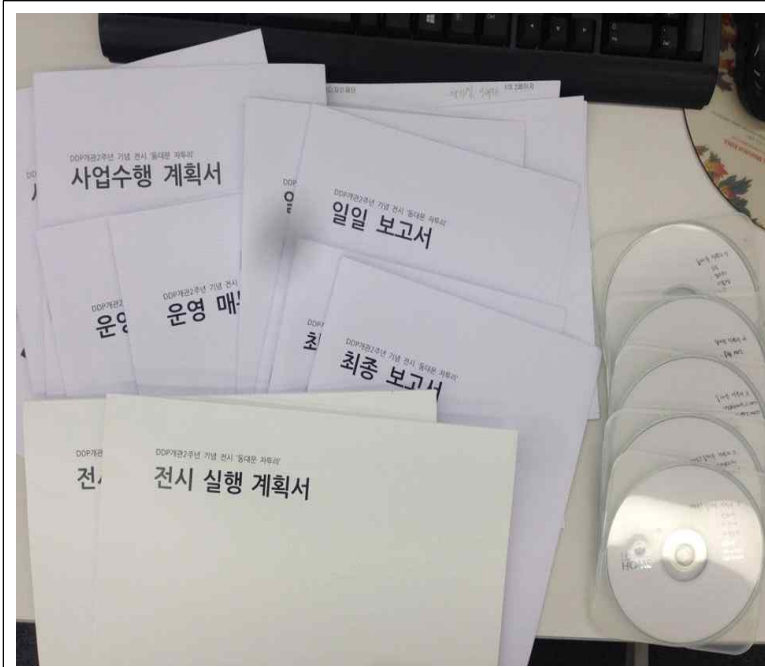
최종 결과보고서, 산출물 및 홍보물 파일