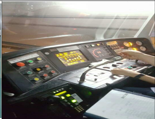
<운전실 승차 점검 >