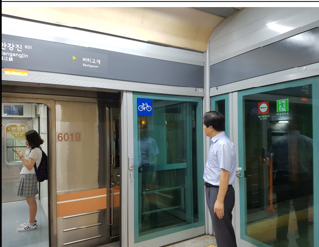
<열차 정위치정차 점검>