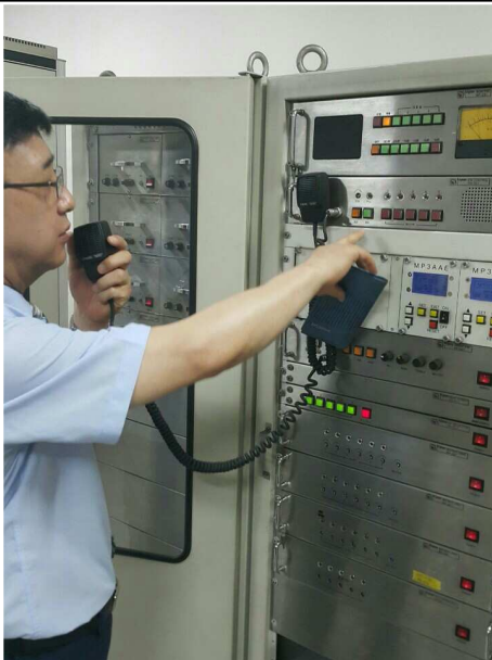
자동방송장치 비상방송 송출 점검