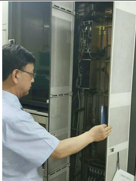
디지털전송설비 가입자보드 점검