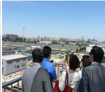
<전망대에서 시설 견학>