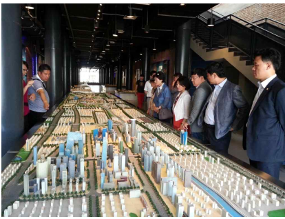
<조양구 도시계획 조감도 설명>