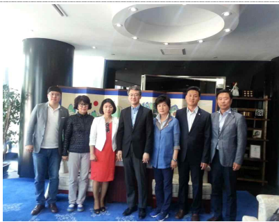
<원장과 단체 기념 촬영>