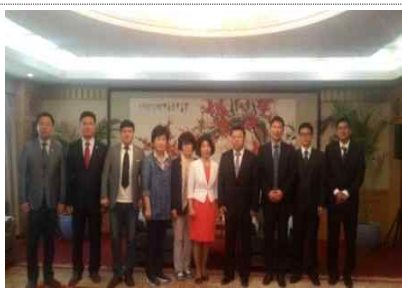
<단체 기념 촬영>