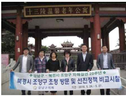
<양로원 입구 기념촬영>