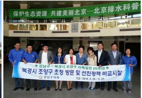
<오수처리업체 직원과 단체 기념촬영>