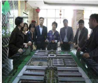
<양로원 실무자 설명>