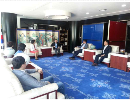
<한국문화원 원장과 환담>