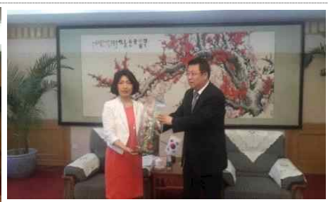
<방문 기념품 교환>