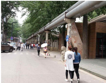
<798 예술의 거리>