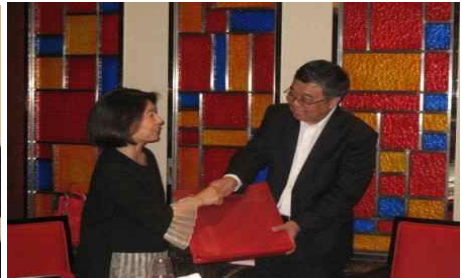
<방문 기념품 전달>