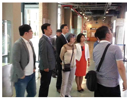
<박물관 유물 관람>