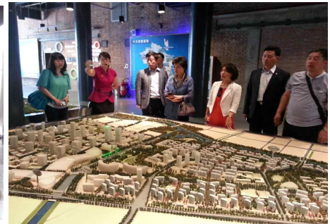
<조양구 CBD지역 설명>