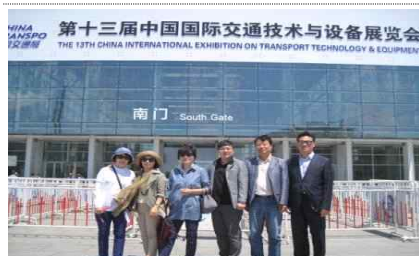
<전시장 입구 기념촬영>