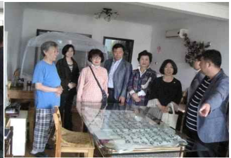
<양로원 개별 숙소 견학>