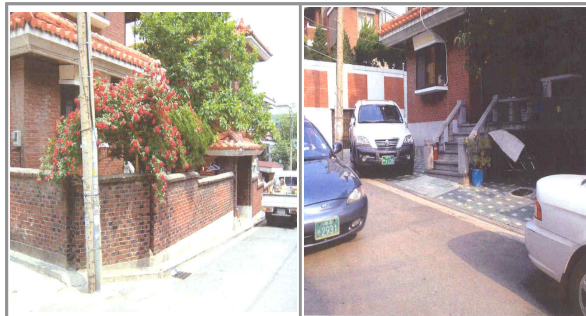
담장허물기, 소통의 시작입니다