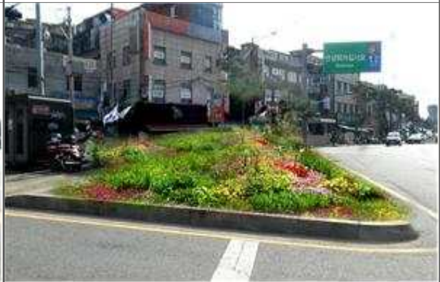
조성 후 모습(예시)