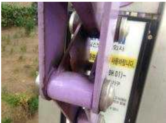
공원시설(운동기구 등) 노후