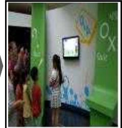
재활용 O × 퀴즈