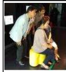
재활용 실천하기 기념사진