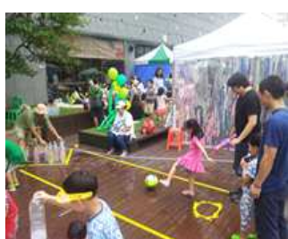
체험 프로그램 (예시)