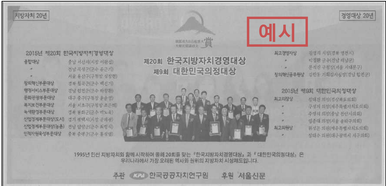
※ 2015년 시상식 후 서울신문 광고(5단 통) 사례