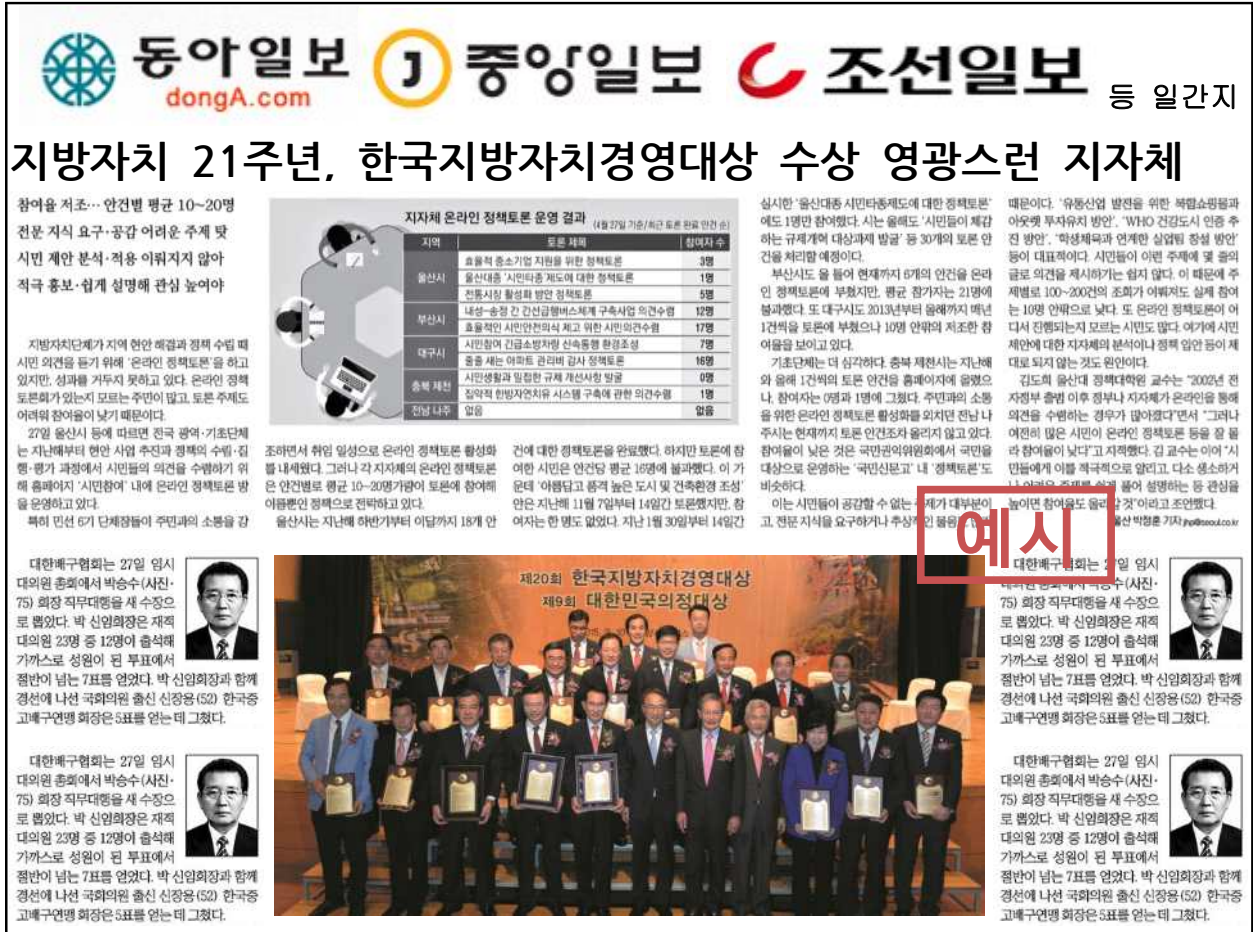
※ 최종 수상자(기관) 발표 후 홍보기사 중앙일간지 보도 예시