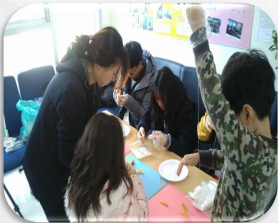
마을 동아리 부스 운영