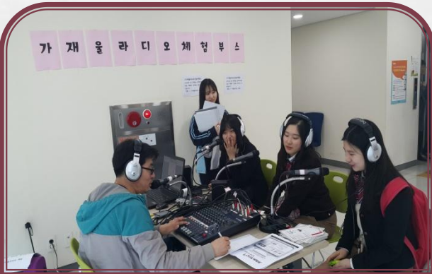
라디오 체험 부스