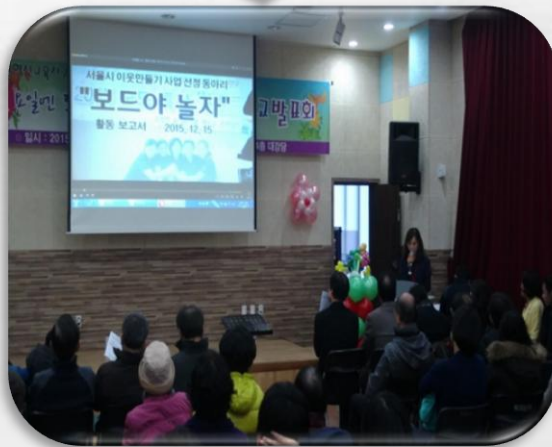
학생과 주민 주도의 발표회