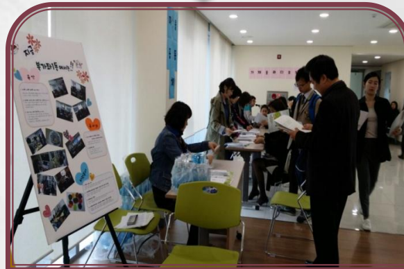
마을공동체 홍보 부스