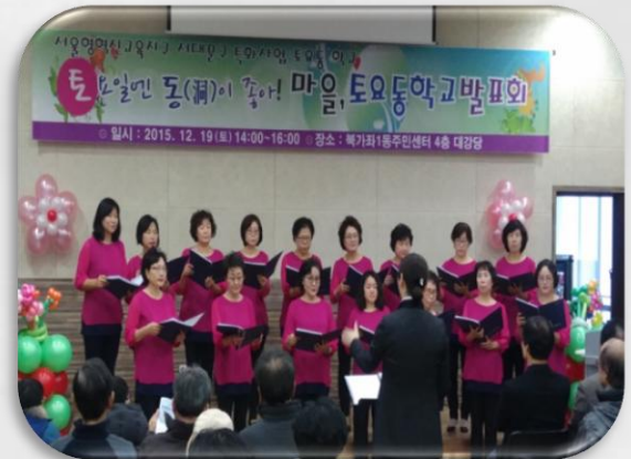
마을 합창단의 축하공연