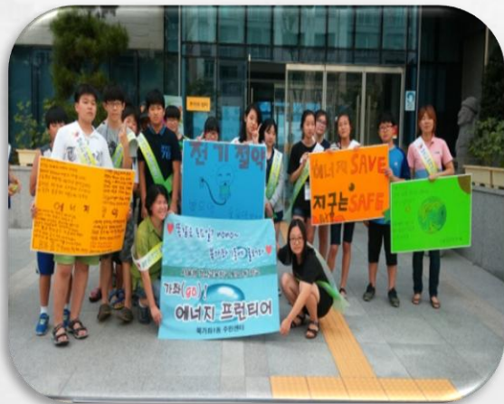
에너지 프론티어(마을 환경강사)