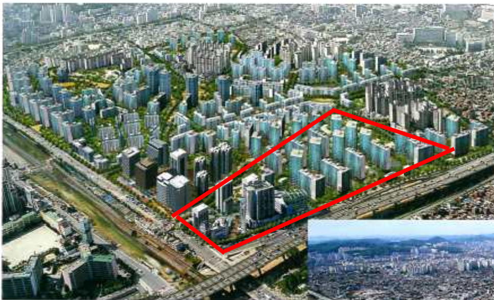
< 가재울 재정비촉진지구 조감도 >

서울의 서북 측에 위치하는 가재울 재정비촉진지구는 자연발생적으로 형성된 전형적 주거지의 부족한 교육시설 및 기반시설을 확충하고자 산발적으로 진행되는 개발사업을 통합하고 광역개발을 통하여 효율적인 기반시설과 지속가능한 주거공간 및 쾌적한 정주환경을 조성하는 사업입니다.