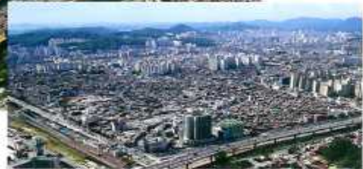
< 2003년도 당시 모습 >