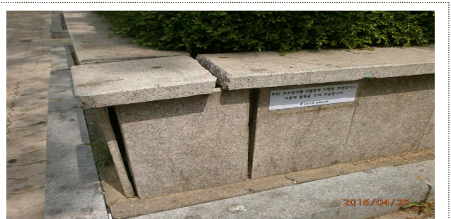
(구청장님 지시사항) 영동대로 216 하나은행 앞 화단 경계석 '16. 6. 17.까지 반드시 조치완료 하겠다고 함 (공원녹지과)