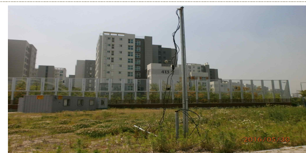
(구청장님 지시사항) 세곡동 숯내교사거리 늘어진 전기선 (도로관리과에서 SH공사에 여러 차례 독촉)