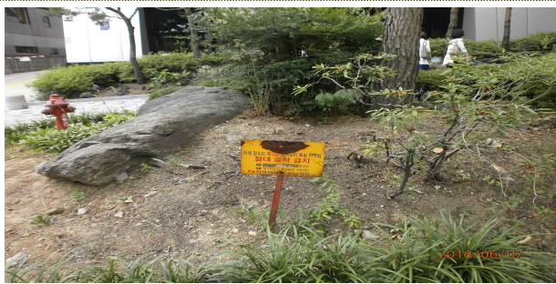
(구청장님 지시사항) 영동대로 319, 325 앞 특고압 굴착금지 안내문