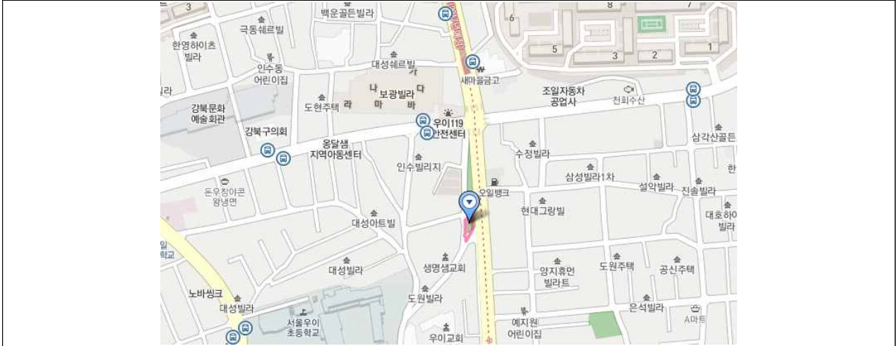
위 치 도(수유동 392-119 우이동길마을마당)