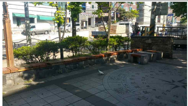
노숙자 방지 팔걸이 설치 추가