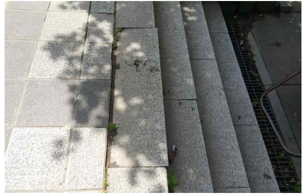
돌계단 탈루(램프로 시공)