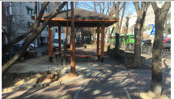
평의자 철거품 산입 필요