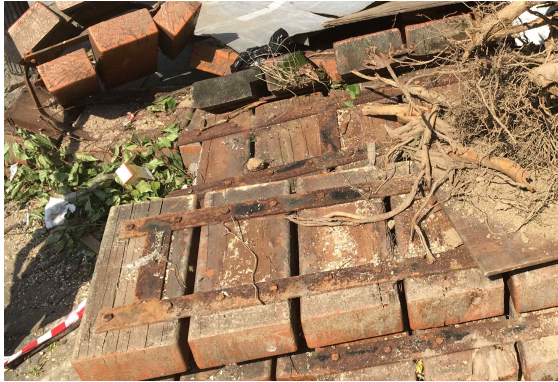
부식된 앉음벽 철제(재활용불가)