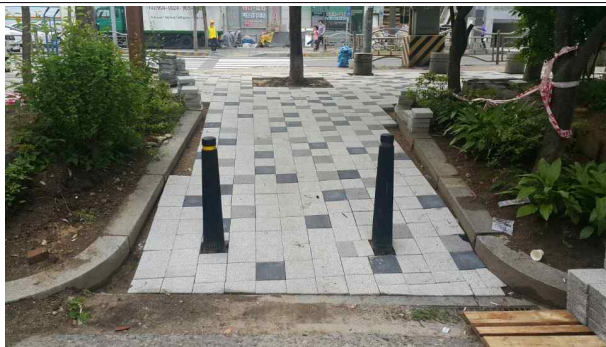
램프 시공 후 목재난간 설치 필요