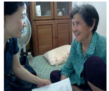
< 방문 건강관리 >