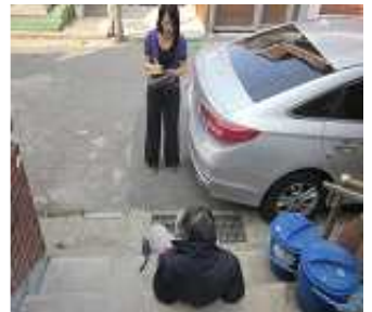
< 노숙인 상담 >