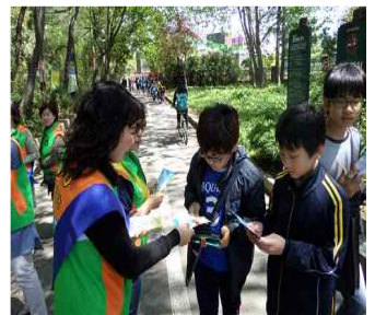
< 폭염 홍보 >