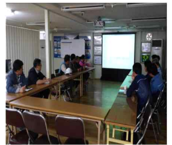
< 공사장 안전교육 >