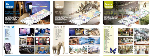
[관람안내 리플릿 내지]