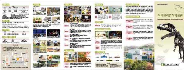
[관람안내 리플릿 표지]