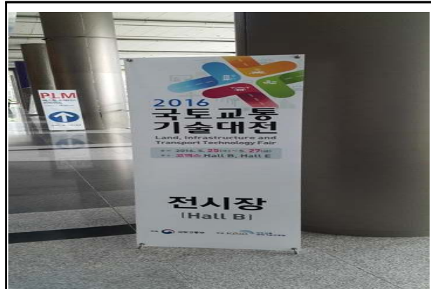
행사장 입구 안내판