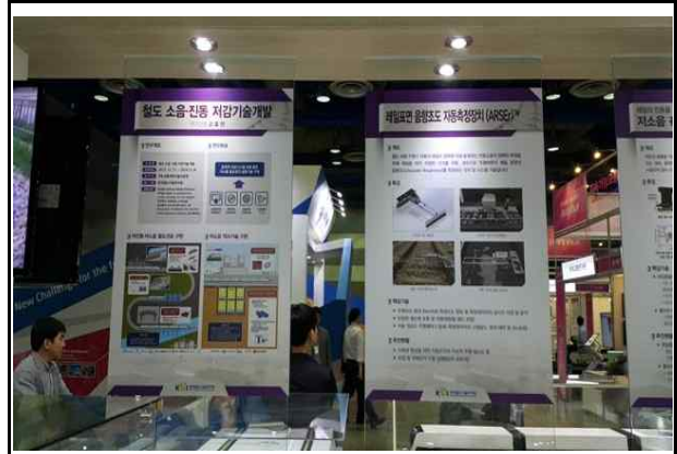
철도 소음 저감장치 관련