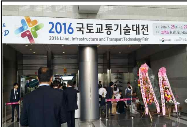
2016국토교통기술대전 행사장 입구