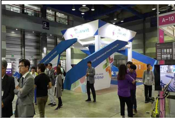
행사장 내부 전경