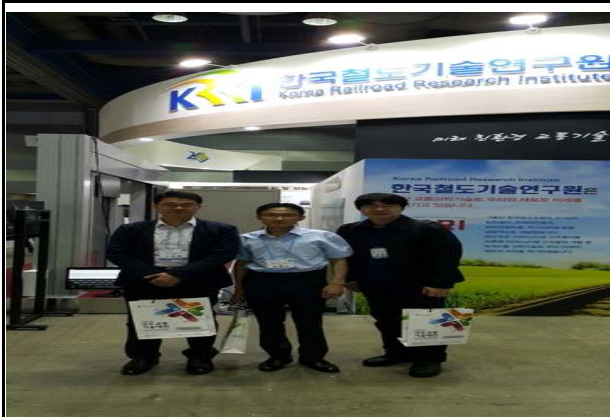
한국철도 기술연구원 전경