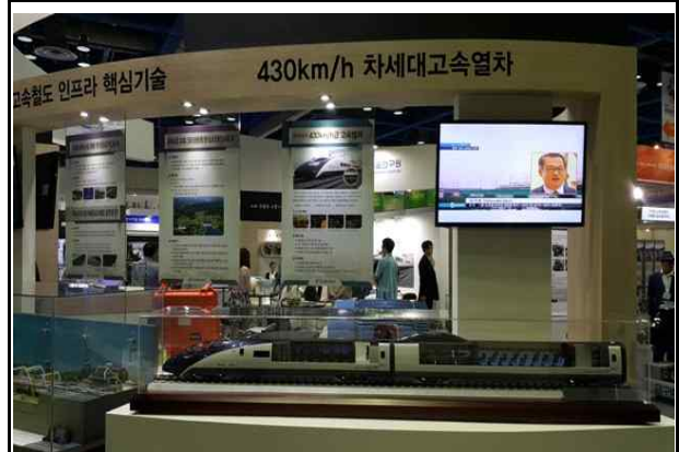
차세대 고속열차 관련