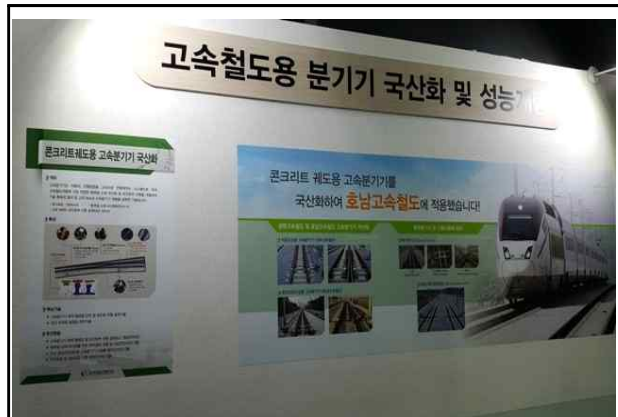
고속철도용 분기기 국산화 관련