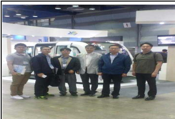
행사 참석자 전경1