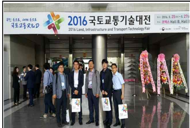
행사 참석자 전경2