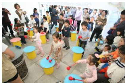
어린이 두드락 팡팡