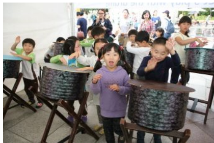
월드 퍼커션 체험