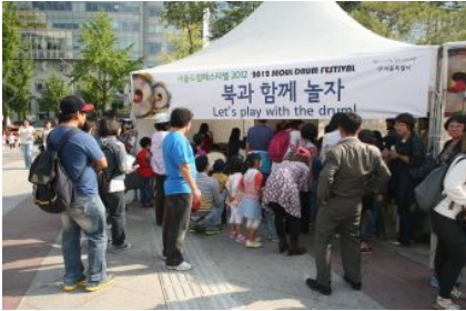
복과 함께 놀자