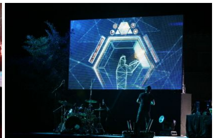
Zero to One