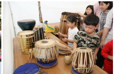
월드 퍼커션 체험