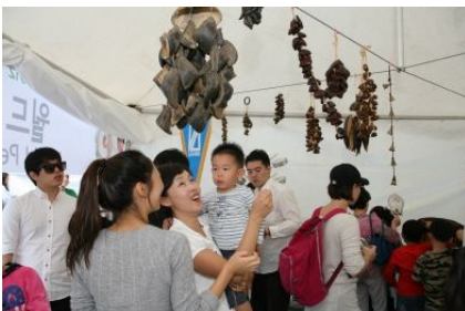
월드 퍼커션 체험