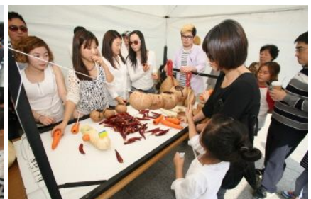
야채악기 만들기 체험