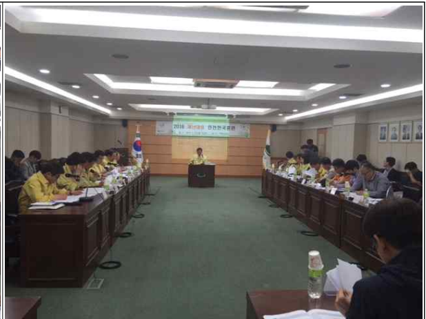
풍수해 대비 토론훈련