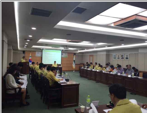
풍수해 대비 토론훈련