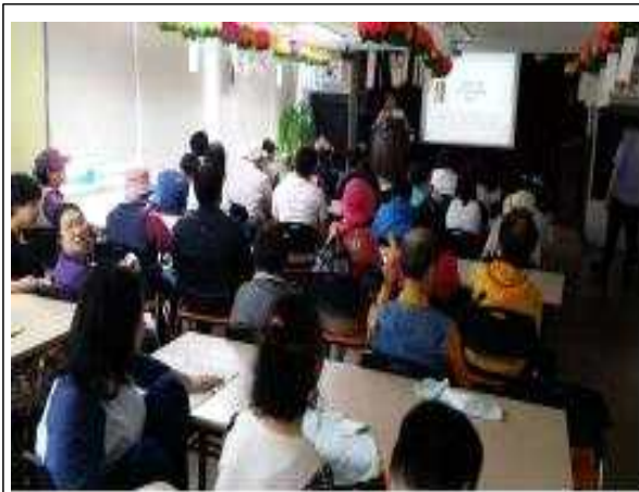
재난약자 대피훈련 교육