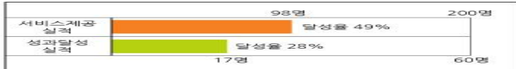
<2016년 5월 현재 학교 밖 청소년 연간 서비스 제공 및 성과 달성 실적>