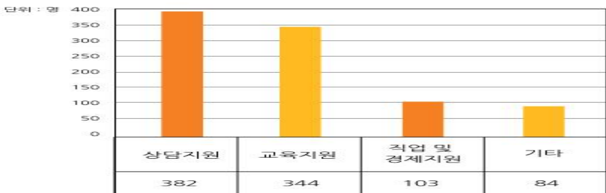
<2016년 5월 현재 학교 밖 청소년 지원서비스 실적>