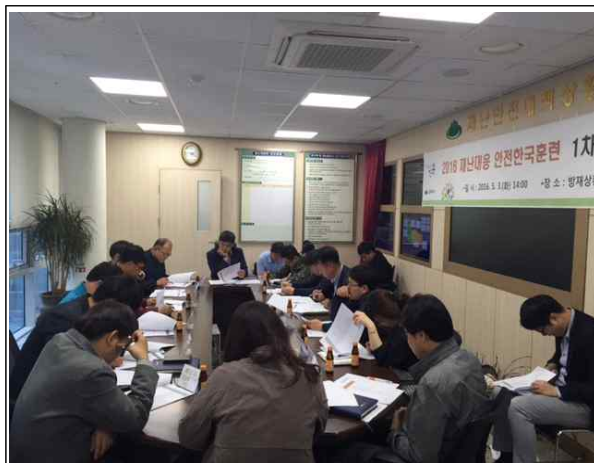
1차 합동회의 (5.3)