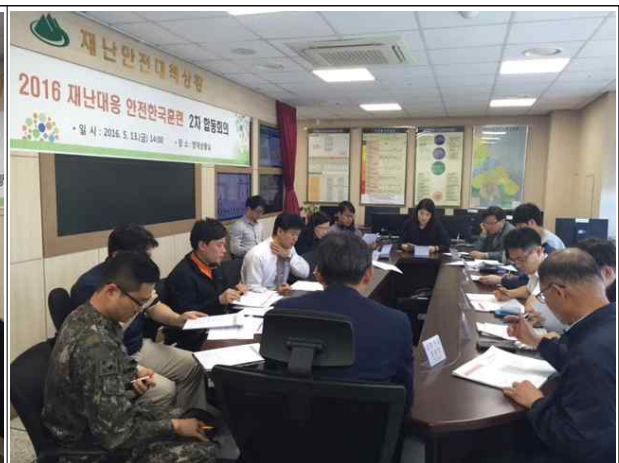
2차 합동회의 (5.13)