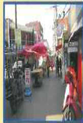
사례) 도로 위 적재물, 가판대 금지