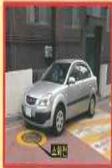
사례) 소방용수시설 5m이내