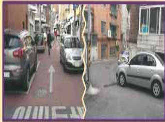
사례) 좁은골목, 길드림이