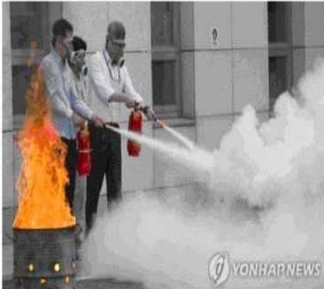
19일 오후 서울 광진구 건국대학교병원에서 열린 2016 재난대응 안전한국훈련에서 훈련참가자들이 화재발생 상황을 가정해 소화기로 화재를 진압하고 있다.