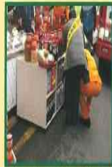
사례) 시장내 황색선 밖 물건적치 금지