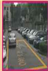
사례) 아파트단지 내 소방차 전용주차구역