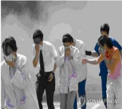
19일 오후 서울 광진구 건국대학교병원에서 열린 2016 재난대응 안전한국훈련에서 훈련참가자들이 화재발생 상황을 가정해 대피를 하고 있다. 2016.5.19