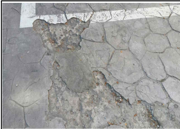
지상주차장 균열 현상