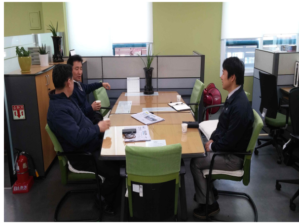
협의 진행 사진