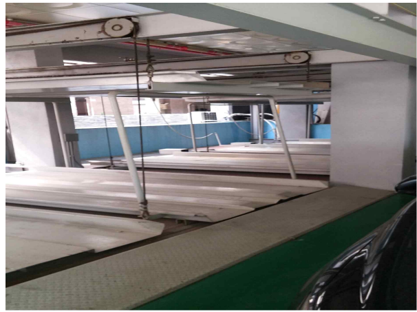
주차기 노후화로 주차기 미사용