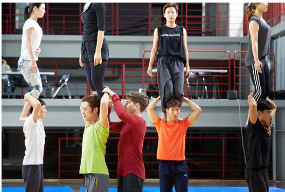
<서커스 전문가 양성과정>