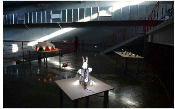
<거리예술 전문가 양성과정 결과발표회>