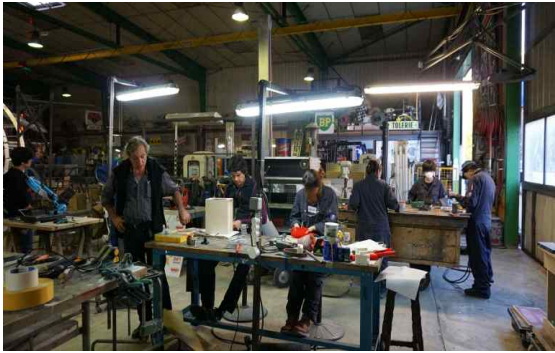
<거리예술 전문가 양성과정>