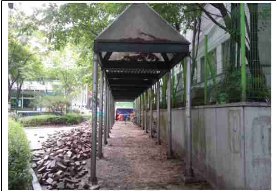
강동구 명일 마을마당