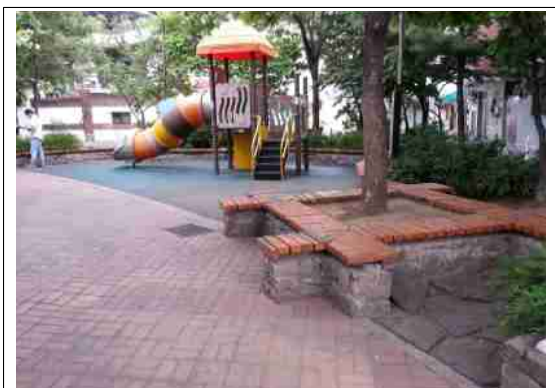
강북구 큰마을 마을마당