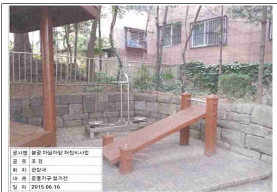
은평구 불광 마을마당