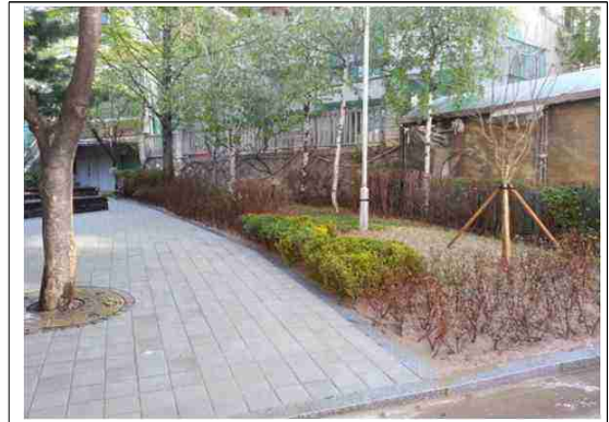
정비후-수목식재, 바닥포장 등