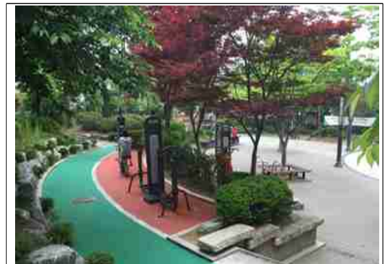
정비후-운동기구, 바닥포장 등