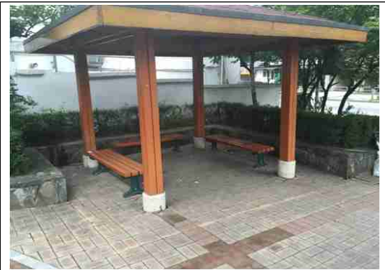
중랑구 정자목 마을마당