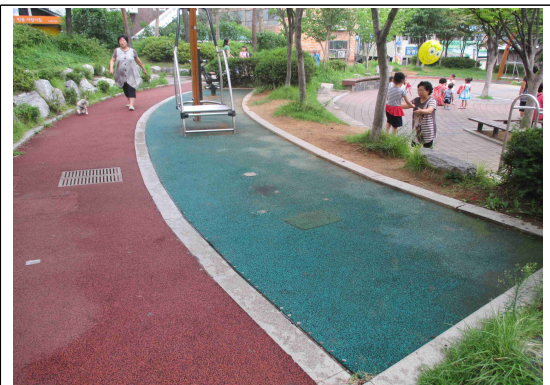
금천구 독산 마을마당