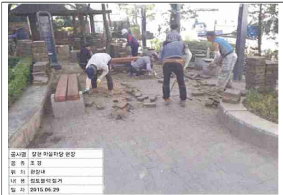
은평구 갈현 마을마당