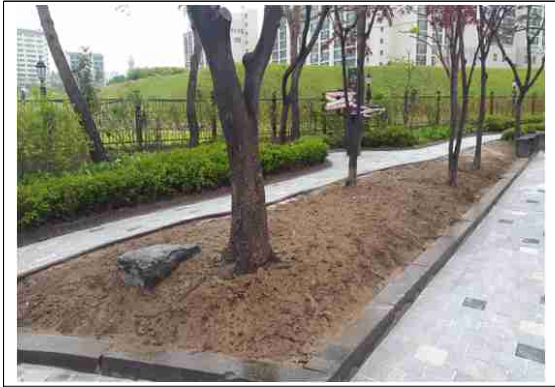
송파구 풍납 마을마당