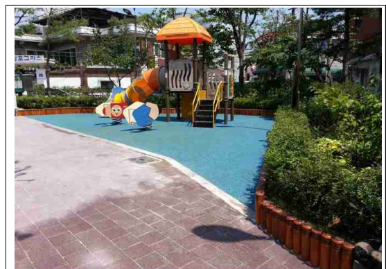
정비후-놀이시설, 바닥포장 등