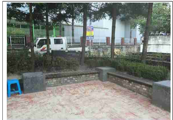
정비후-앉음벽, 바닥포장 등