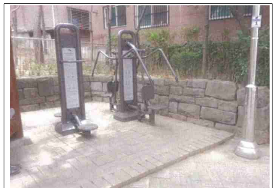
정비후-운동기구 설치 등