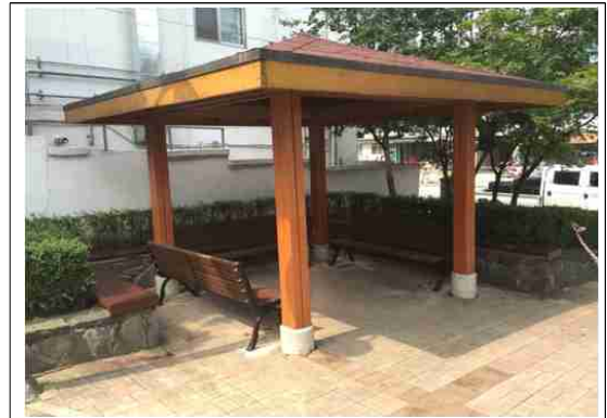
정비후-앉음벽, 등 의자 등