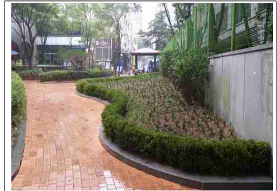
정비후-파고라철거, 수목식재 등