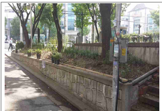
서초구 양재 마을마당