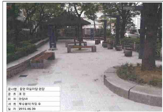
정비후-바닥포장 교체 등