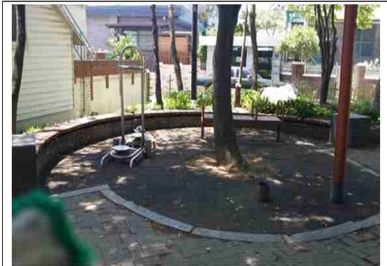
강서구 개화 마을마당