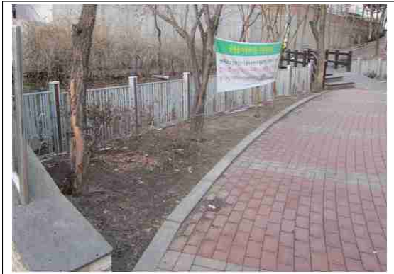
성북구 정릉천변 마을마당