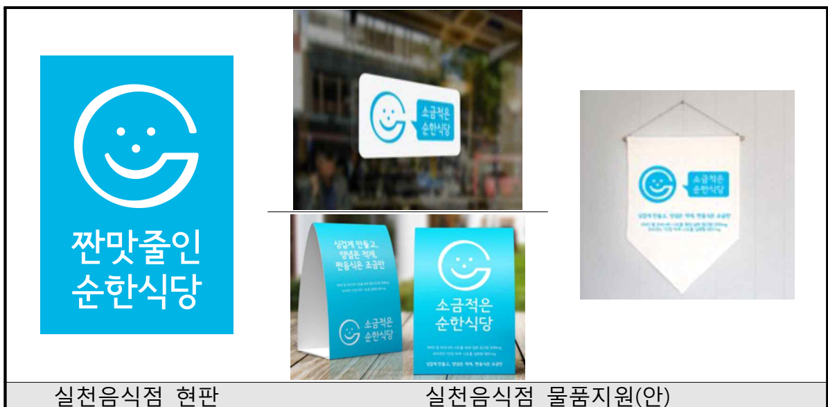
<저염실천음식점 현판 및 물품지원(안)>