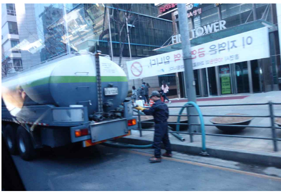
청소행정과 | 강남대로 보도 물청소 실시