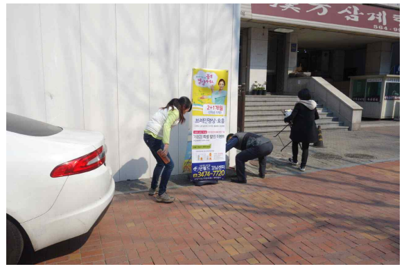
감사담당관 | 강남대로 보도위 회원모집 가판대 정비