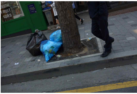
감사담당관 | 강남구청역 부근 쓰레기 시간외 배출