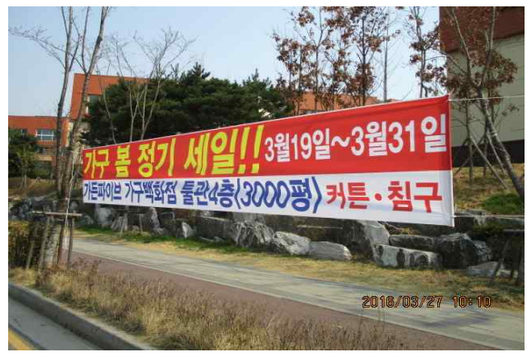
도시계획과 | 자곡로 현수막 정비