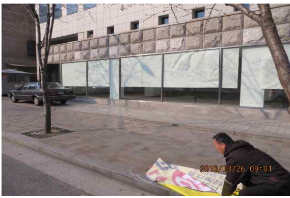
역삼1동 | 강남대로 불법현수막 정비