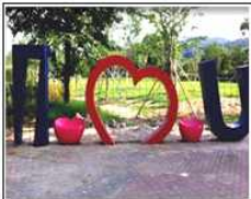
남만 산책길 포토 존 조성