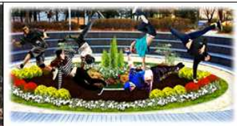
왕십리 광장(북측) 비보잉 이야기길터 조성