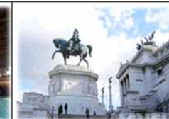
한강 중랑천 합수부 통일 상징물