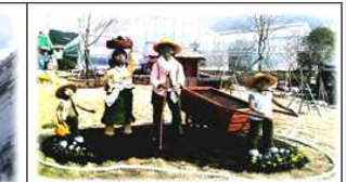
왕십리역사 철도공원 조성(공개공지 활용)