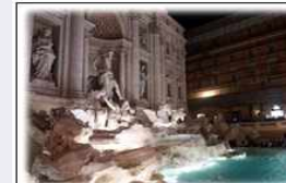
왕십리 광장 명품 분수대 설치