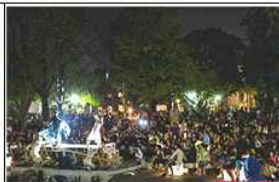
왕십리 문화공원 버스킹 상설화