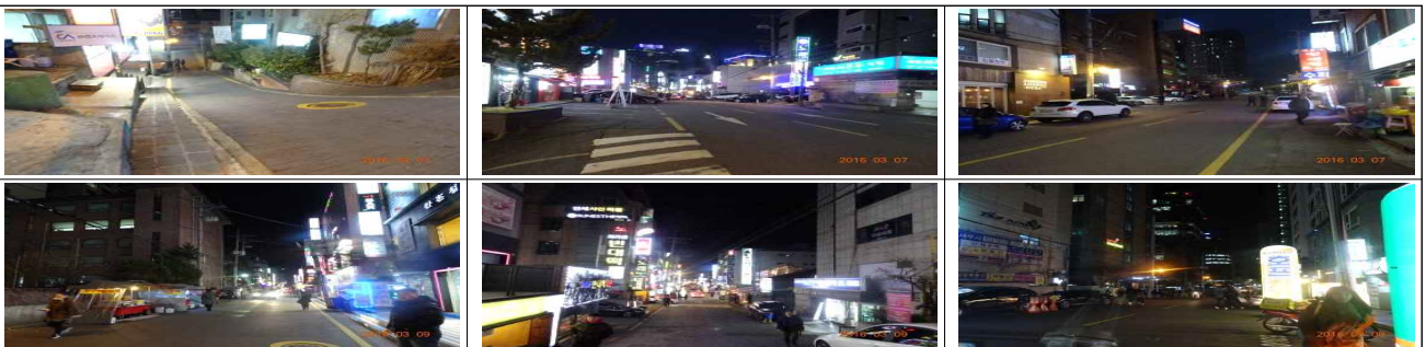
불법 전단지 무단배포 야간 현장 단속