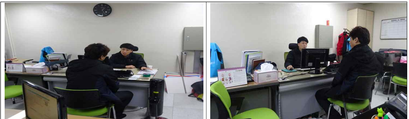
피의자 신문 시행