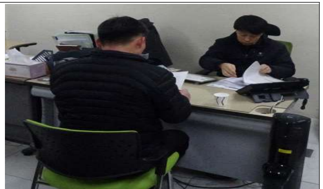
피의자 신문 시행