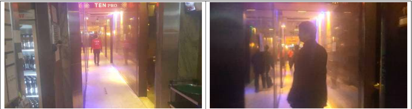
유흥주점과 단란주점 미구획 상태 영업