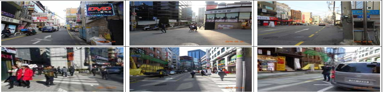
불법 전단지 무단배포 주간 현장 단속