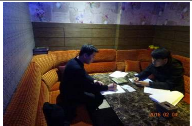
영업주 확인서 작성