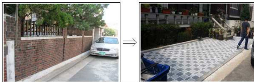
< 담장허물기사업(북가좌동 74-136) 공사 전·후 >