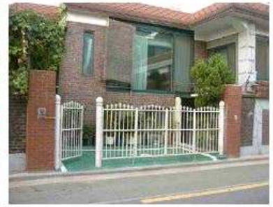
<현재-현관 출입문 주변 목책문 설치>